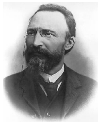
Bienheureux Bartolo Longo