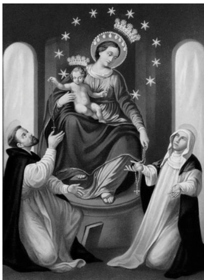
Tableau miraculeux de Notre-Dame du Rosaire de Pompéi

Il est enterré à Pompéi aux pieds de l'image miraculeuse. Il sera béatifié par le pape Jean-Paul II le 26 octobre 1980. Sa fête est le 6 octobre. Par amour de Marie, il est devenu selon ses propres dires, apôtre de l'Evangile, écrivain, propagateur du Rosaire, fondateur d'instituts de charité, mendiant pour les pauvres.